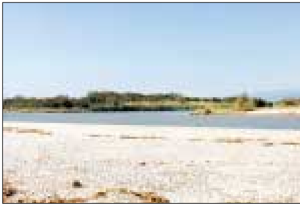
AREA ARCHEOLOGICA, MARULLO: LA FITORIMEDIAZIONE SI PUO' EVITARE

La società internazionale Europaradiso è uno dei dodici "pirati" che, secondo Legambiente nazionale, si sono distinti nell'ultimo anno per "attacchi o danni all'ambiente marino-costiero". Il poco ambito riconoscimento, che lo scorso anno fu consegnato all'ex governatore, Giuseppe Chiaravalloti, per le inefficienze nel campo della depurazione, è stato attribuito con l'uscita di "Mare monstrum", l'annuale rapporto dell'associazione ambientalista sullo stato di salute del mare e delle coste italiane. Legambiente contesta la realizzazione del mega villaggio turistico alla foce del fiume Neto (nella foto), area già individuata, secondo le direttive dell'Unione europea, come sito d'interesse comunitario. PEDACE a pagina 3